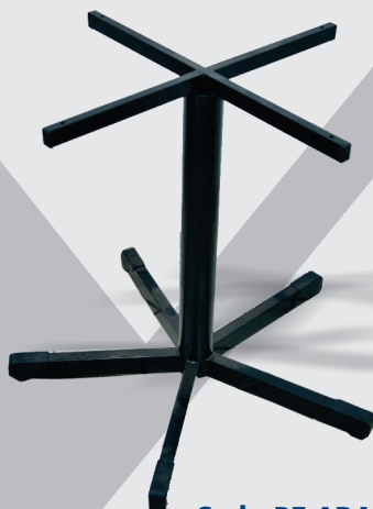
Cod.: PE ARANHA